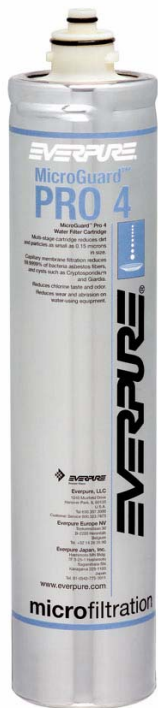
MicroGuard™ Pro 4 Patrone: 9637-02

Trinkwasser in Premiumqualität für flaschenlose Cooler und Trinkwasserbrunnen